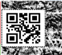
អំពូតស្រួល